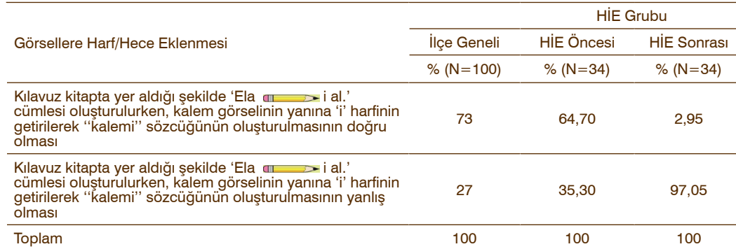
Tablo 11. Araştırmaya Katılan Öğretmenlerin Okuma-Yazma Öğretiminde Cümlelerde Görsellerden Yararlanılmasının Yönelik Görüşlerinin Dağılımı

Hizmet içi eğitime katılacak öğretmenler (%64.7) ve ilçe genelinde görev yapan öğretmenlerin (%73) cümlelerde yer alan görsellere harf eklenerek sözcük oluşturulmasını doğru bulduğu belirlenirken hizmet içi eğitim sonunda ise öğretmenlerin neredeyse tamamının bu uygulamayı yanlış bulduğu belirlenmiştir. Aşağıdaki tabloda hecelerden sözcük oluşturma uygulamalarına yönelik araştırmaya katılan öğretmenlerin değerlendirmeleri bulunmaktadır.